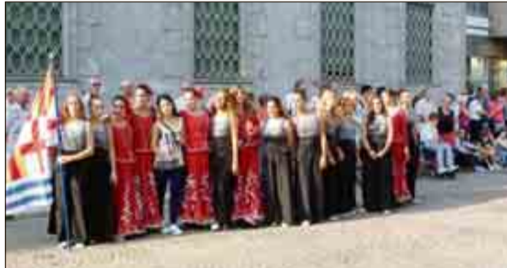
Les noies de l'Aula - Escola de Dansa, moments abans de la desfilada pel centre de la ciutat de Lecco, i després de la seva actuació a la plaça.

Dissabte tenia lloc una gala de ballet amb la intervenció d'alumnes de les dues escoles, que van oferir una excel·lent representació davant un nombrós públic que va rebre amb grans aplaudiments les diferents actuacions, tant del grup italià com l'igualadí. Les igualadines han estat acollides en les cases de les seves amigues de Lecco i diumenge van tornar a actuar a la plaça pública en un acte que també va comptar amb bandes de música de ciutats agermanades amb Lecco com Sombatelli (Hongria), Macon (França) i Overije, amb un total de 160 músics. L'actuació folklòrica va comptar també amb la presència dels dos grups de dansa que van actuar en primer lloc, iniciant posteriorment una desfilada pels carrers del centre de la ciutat per rebre les bandes en una plaça totalment plena de públic.