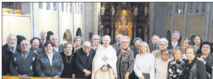
Cantaires, oficiant i regidora en acabar la solemne festa de la Sagrada Família. (Foto Jaume Vila).