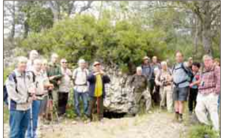
Al peu de la boca d'entrada a l'avenc de la Censada.

Passem per les torres Homs, bon lloc per esmorzar i celebrar a